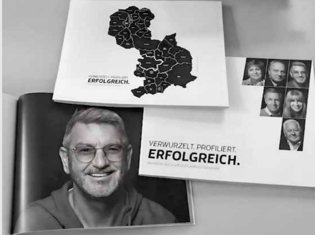
Buchprojekt zum 70-jährigen Bestehen des VVO »VERWURZELT.PROFILIERT.ERFOLGREICH.«